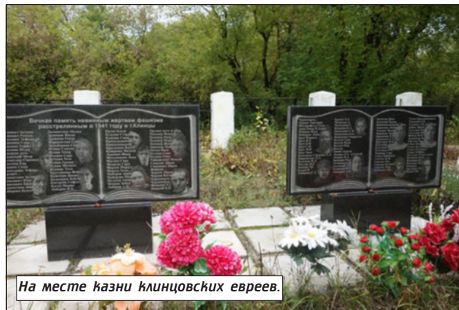
На месте казни клинцовских евреев.