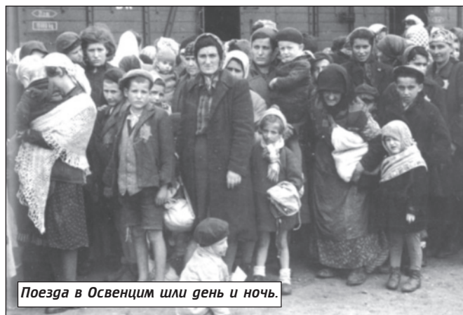
Поезда в Освенцим шли день и ночь.